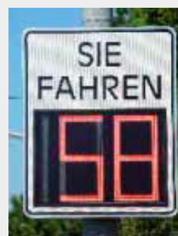
Exemple d'un GR32 en format portrait et une face avant personnalisée.

Le GR42 est disponible aux formats Portrait ou Paysage .